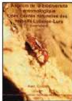
Aspects de la biodiversité entomologique des cavités naturelles des massifs Luberon-Lure [Coleoptera], 2007, 356 p.