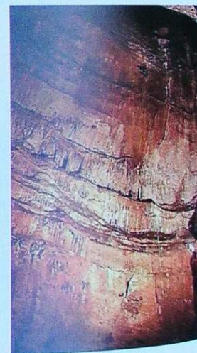
Le puits-cheminée de l'Aven Noël, d'une hauteur de 90 m.

- Il existe des puits de jonction, sorte de conduits verticaux, reliant deux étages entre eux. Les morphologies de ces puits ont été acquises dans un contexte noyé et révèlent un sens remontant d'écoulement de l'eau d'un étage à l'autre, ce sont des puits-cheminées. On peut citer comme exemple de puits-cheminée celui de l'Aven Noël qui se développe sur près de 90 m de haut. La présence de ces puits-cheminées reliant les étages entre eux est l'argument hydrodynamique de l'étagement per ascensum des galeries de Saint-Marcel.