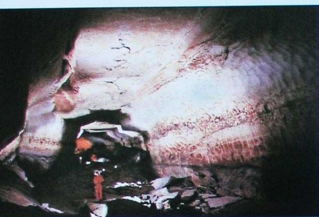
La galerie des Maçons de la grotte de St-Marcel. Cette galerie « fossile » compte parmi les plus grands volumes de la grotte.

La reconstitution de l'évolution de l'Ardèche depuis six millions d'années permet ainsi d'appréhender les différentes positions qu'ont occupé le Rhône et l'Ardèche sous l'effet des oscillations du niveau de base marin (voir cadre temporel messino-pliocène). La prise en compte récente des grandes phases d'oscillations du niveau des rivières autorise une relecture inédite de la formation des grottes des gorges de l'Ardèche et plus particulièrement de la grotte de Saint-Marcel (Mocochain et al. , 2006a ; Mocochain et al. , 2006c).