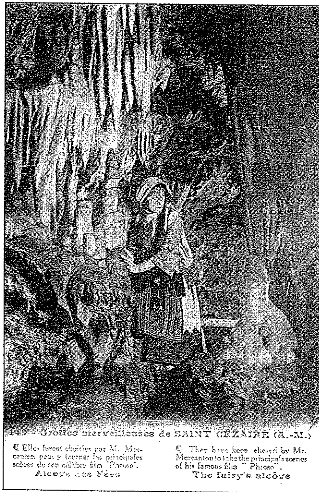
Grotte de Saint - Cézaire.

La liste a été élaborée selon le principe suivant : « Padirac : une ligne », ce qui exclut l'énumération de toutes les vues d'une même cavité. Ce principe de base permet de recenser toutes les cavités illustrées par des cartes postales anciennes. Ce catalogue classe les cavités par département, puis énumère par ordre alphabétique les noms de cavités ou phénomènes karstiques (sources, arches, ponts naturels, etc.) ; inutile de préciser que ce catalogue est appelé à évoluer.