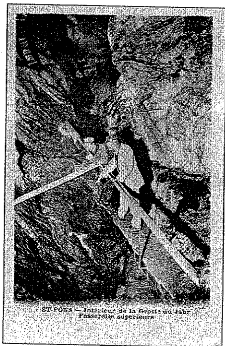
Grotte du Jaur à St Pons. Hérault